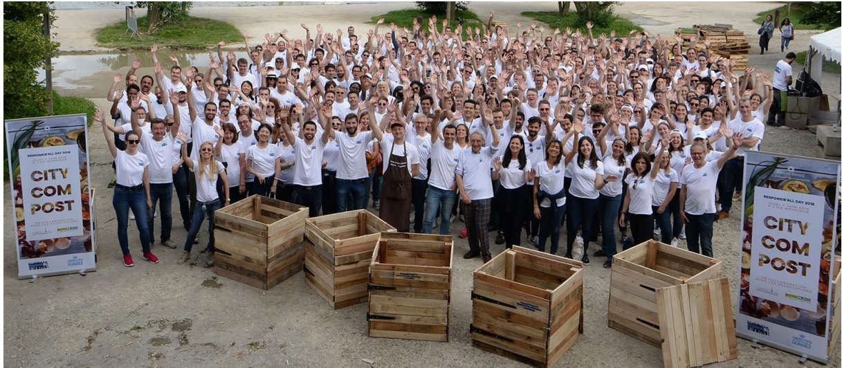
Le Responsib'All Day 2018 à Paris